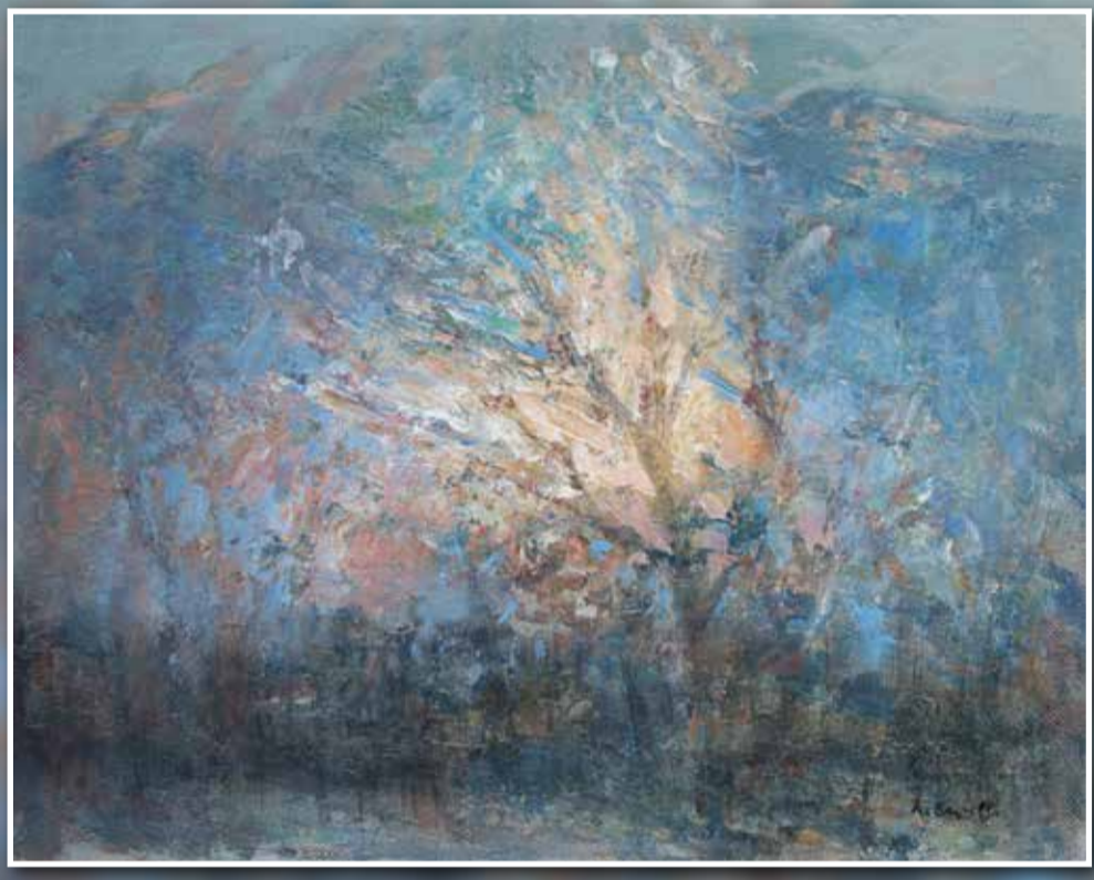
LUCI AL MATTINO