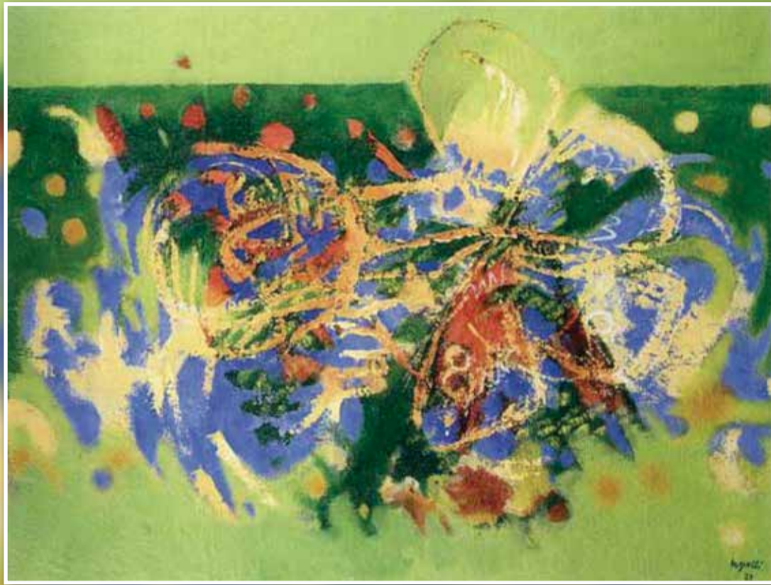
VITA E NATURA DA SALVARE