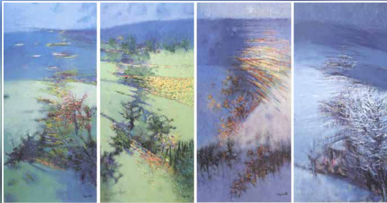
LE QUATTRO STAGIONI