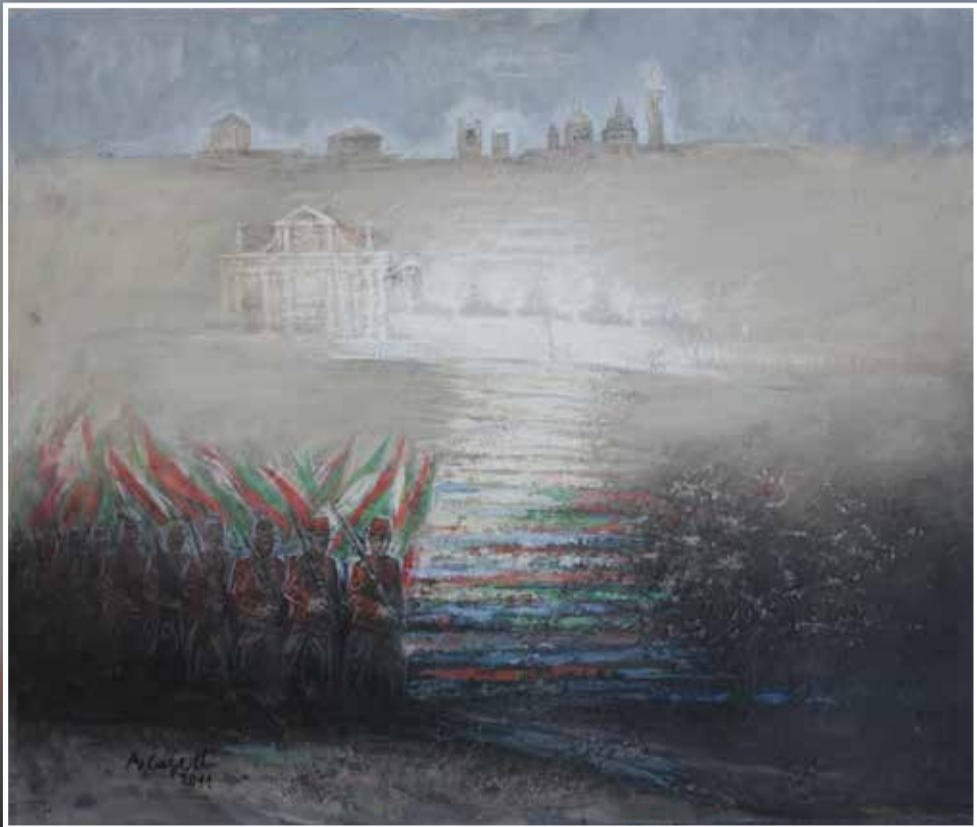
SPEDIZIONE DEI MILLE