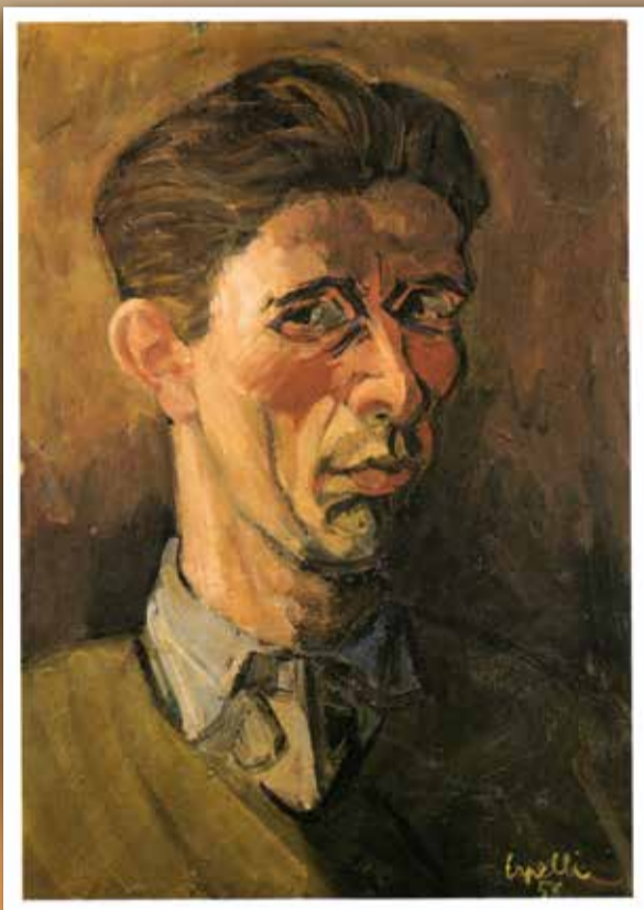
ANGELO CAPELLI L'AUTORITRATTO - NEL MESE DEL COMPLEANNO DEL PITTORE