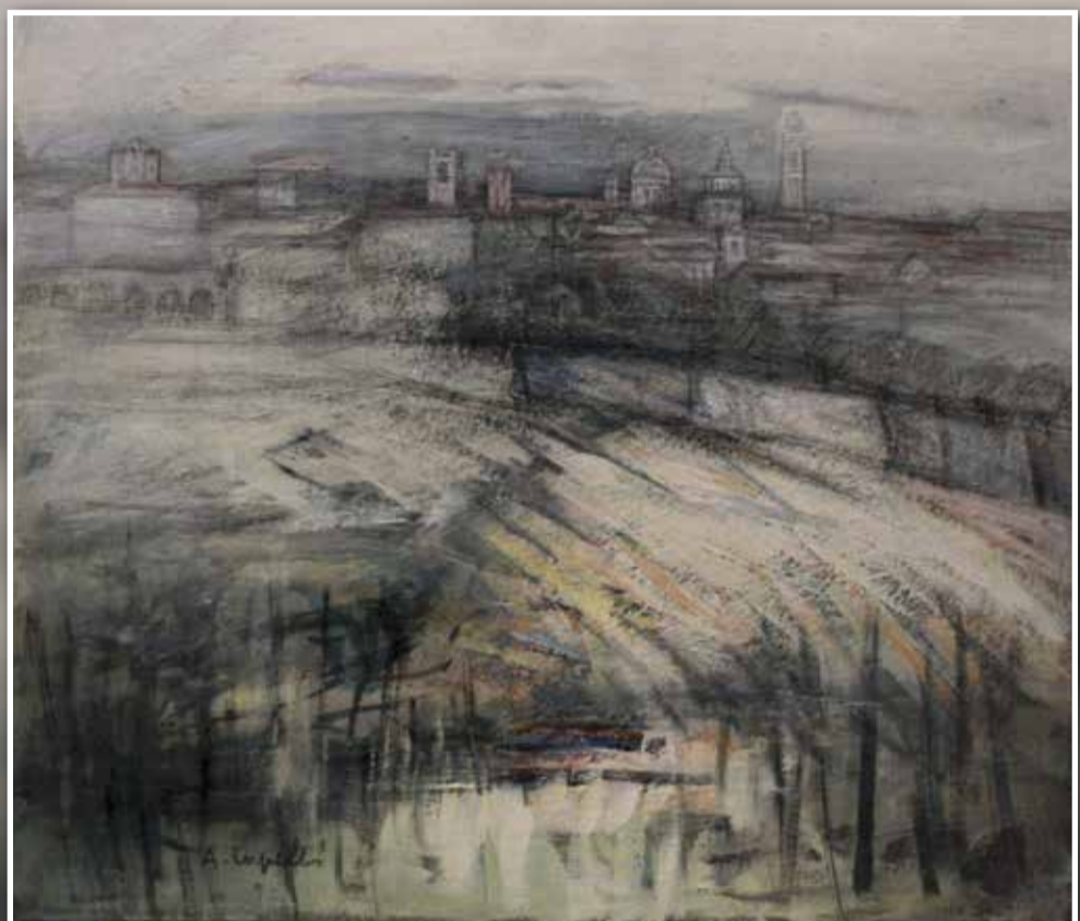
CITTÀ ALTA D'INVERNO