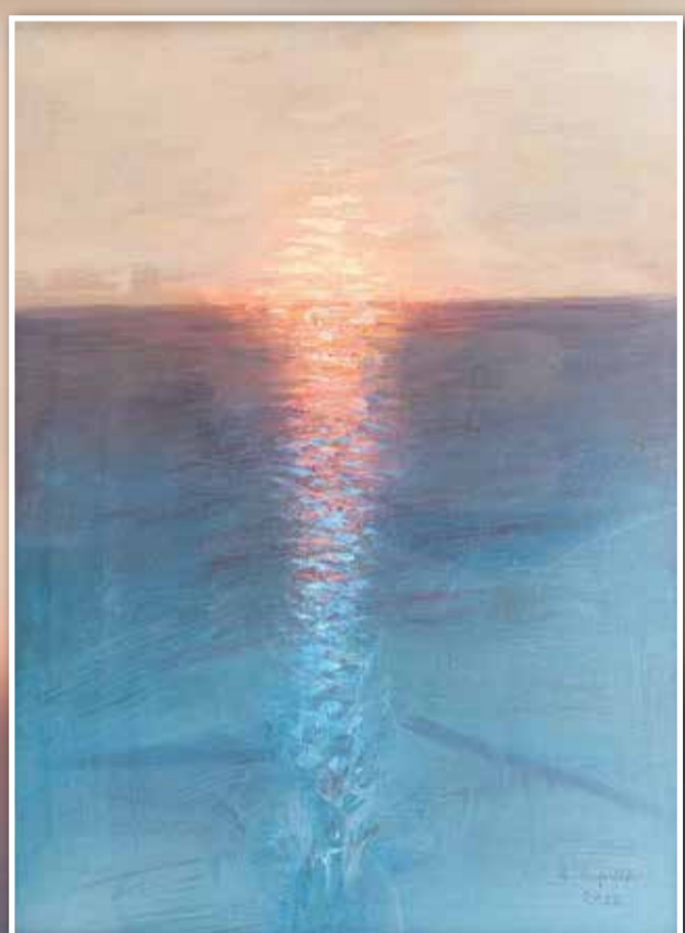
TRAMONTO INVERNALE - ULTIMO DIPINTO