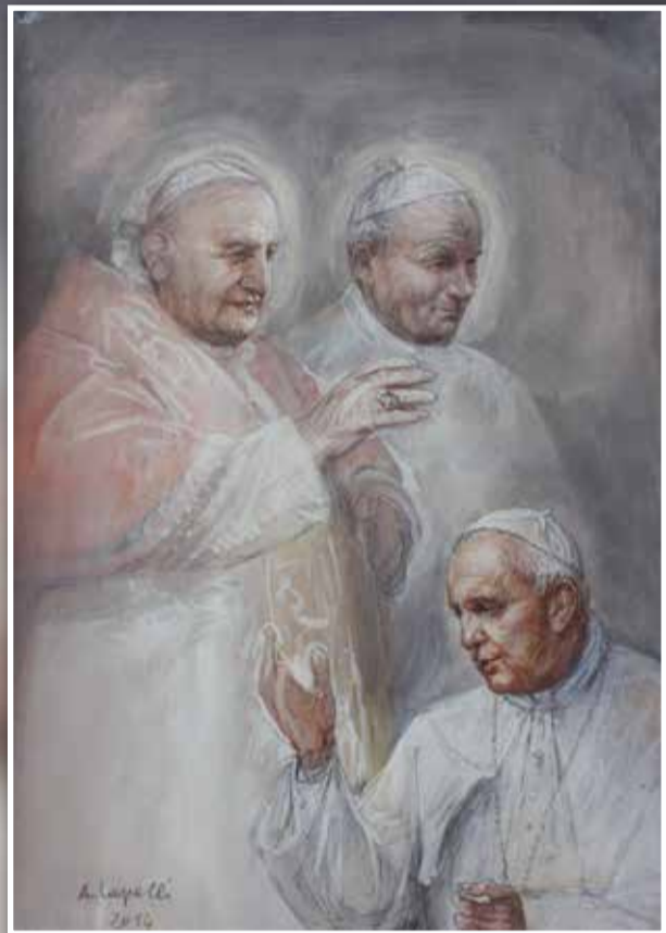
13 PAPI - IN OCCASIONE DELLA CANONIZZAZIONE DI GIOVANNI XXIII E GIOVANNI PAOLO II